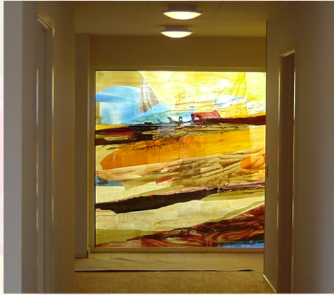
Et af glasmosaik vinduer set fra gangen.