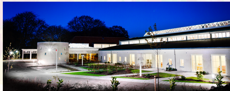
Natbillede af hospice Fyn med glasmosaik i baggrunden.

og gipsstukvæggen overfor, udført af brdr. Funder, men mange ved måske ikke hvad baggrunden er for disse kunstværker.