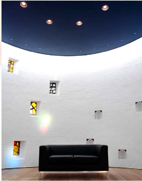
Det runde stillerum med små glasmosaikker.